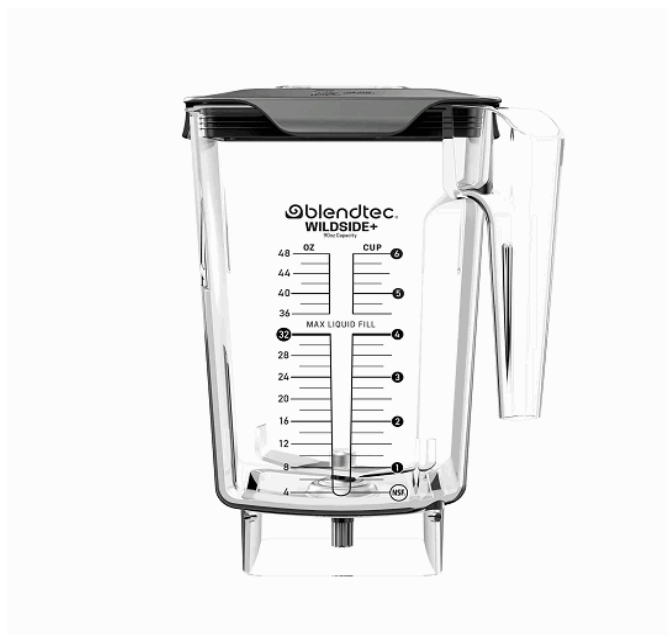
Imagen con fines ilustrativos, las características visuales del equipo pueden variar.