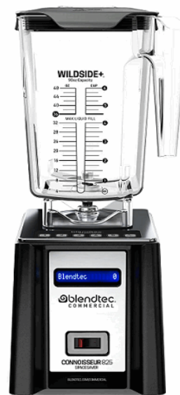
Imagen con fines ilustrativos, las características visuales del equipo pueden variar.