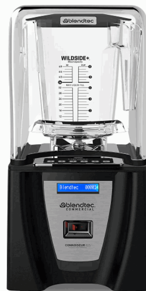
Imagen con fines ilustrativos, las características visuales del equipo pueden variar.