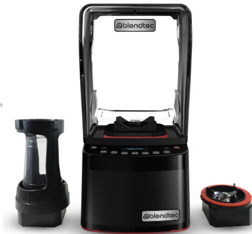
Imagen con fines ilustrativos, las características visuales del equipo pueden variar.